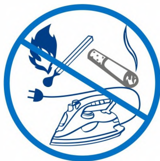
ЗАЖИГАТЬ СПИЧКИ, КУРИТЬ, ВКЛЮЧАТЬ И ВЫКЛЮЧАТЬ ЭЛЕКТРОПРИБОРЫ